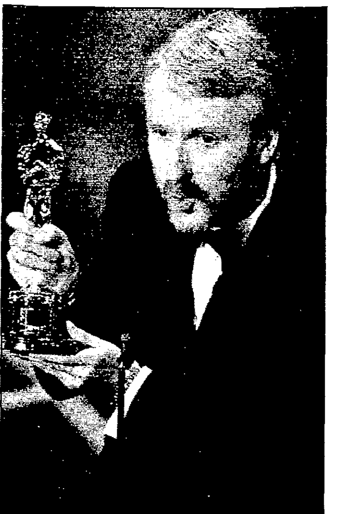
جيمس كاميرون، مخرج «تاييتانيك»